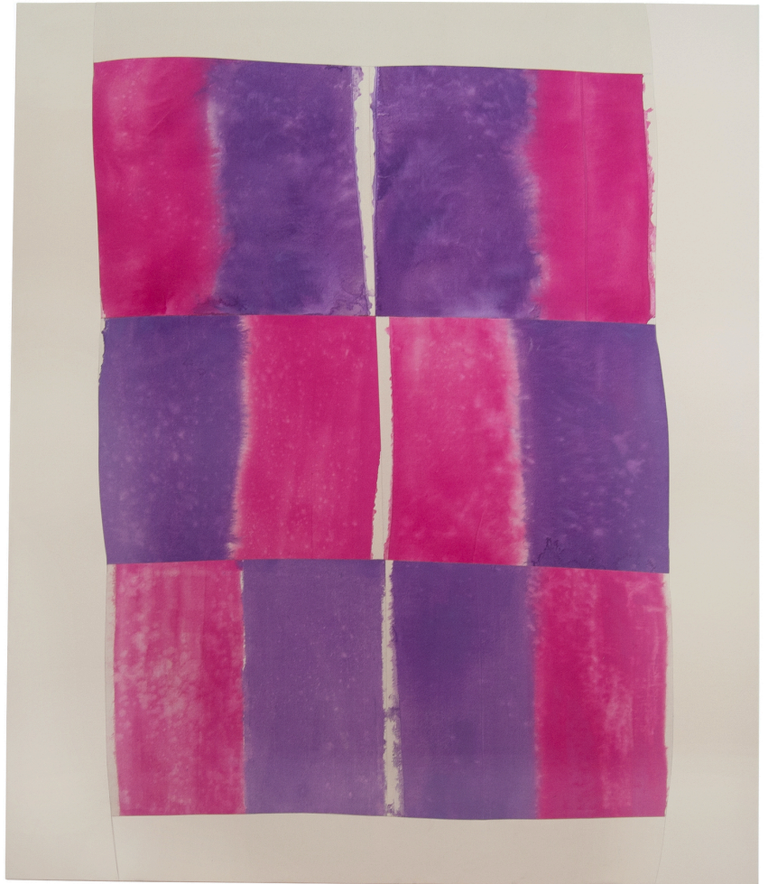
Forever And Ever

2022 Acryl auf Baumwolle (vernäht) 200 x 170 cm