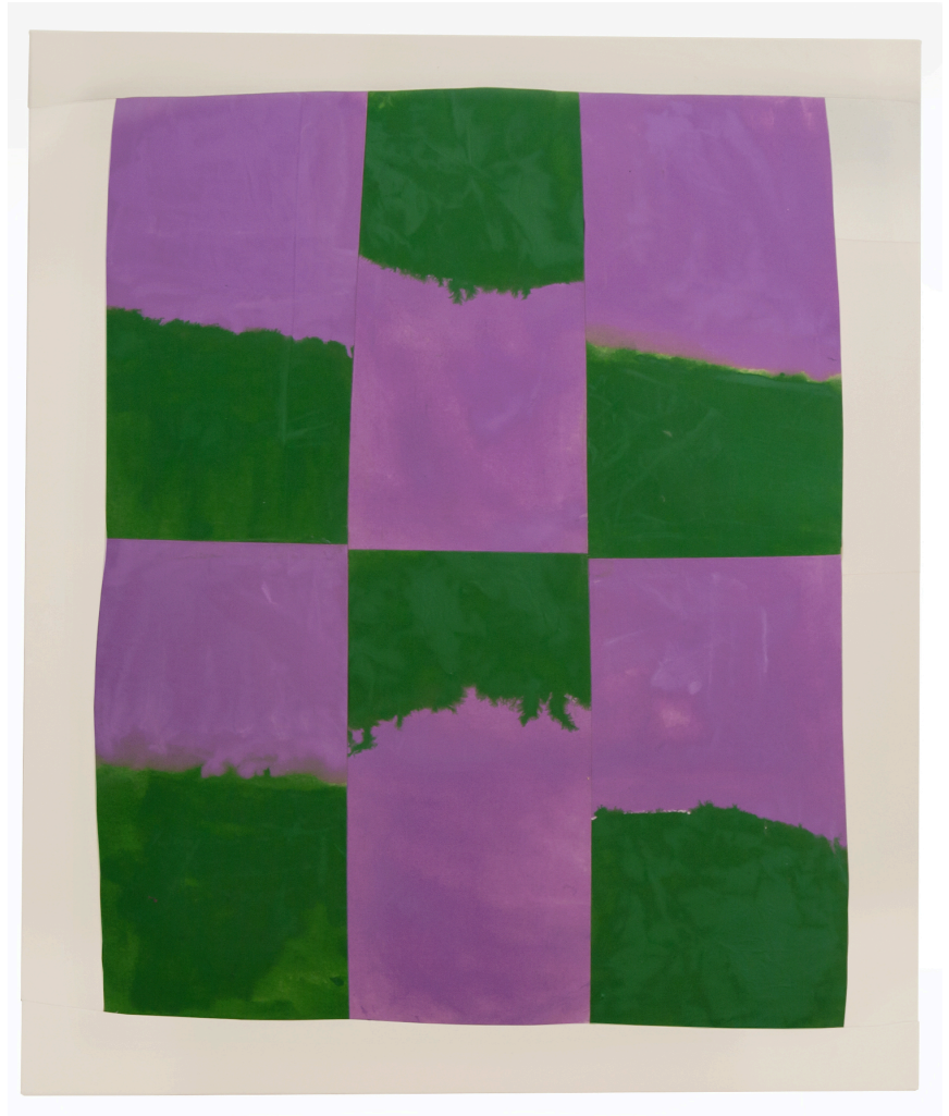
Truth or Dare

2022 Acryl auf Baumwolle (vernäht) 130 x 110 cm